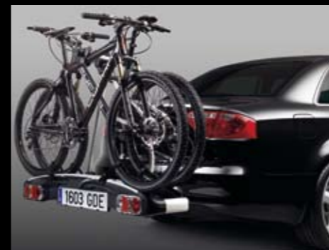
Portabicicletas trasero.** Rear-mounted bicycle rack.** Porta-bicicletas traseiro.** 3R0071128A