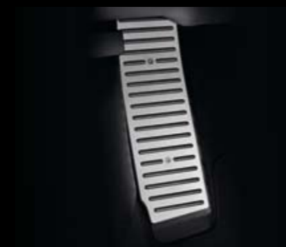
Reposapiés. Footrest. Apoia-pés. 3R0071750