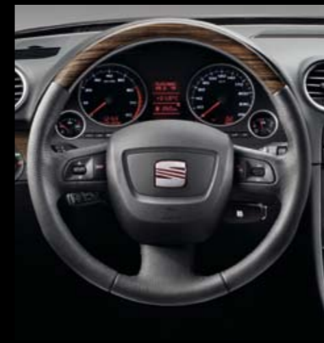
Acabado Wengué.* Wengue finish.* Acabamento Wengué.*