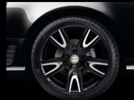
Diamantada negra DV179 8x18" ET42 5x112. DV179 8x18" ET42 5x112 Black Diamond. Diamantada preta DV179 8x18" ET42 5x112. Ref. 3R0071497