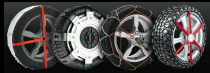
Cadena textil. Spikes Spider. metálica eslabón 9mm. Composite. Textile wheel covers. Spikes Spiders. 9 mm link metal chain. Composite. Corrente têxtil. Spikes Spiders. Corrente metálica elo de 9 mm. Composite.