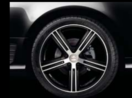
Diamantada negra DV180 8x18" ET425X112. DV179 8x18" ET42 5x112 Black Diamond. Diamantada preta DV179 8x18" ET42 5x112. Ref. 3R0071499

SEAT Accesorios te ofrece una gama exclusiva de llantas de 18" para tu EXEO. Líneas más agresivas, más deportivas que ofrecen diseño, seguridad y máxima calidad. Así como tu EXEO es diferente, tus llantas también lo son, están desarrolladas con el coche, siendo el resultado final unas llantas de aleación ligera totalmente fiables, duraderas y que aportan los máximos niveles de seguridad bajo cualquier situación.