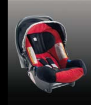
SEAT Peke Go Plus. 000019220A

CHILD SAFETY SEATS. ASSENTOS DE SEGURANÇA INFANTIL.