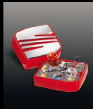
Estuche de lámparas. Set of bulbs. Estojo de lâmpadas. 000052173A