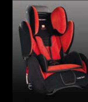
Recaro Young Sport. 000019950D