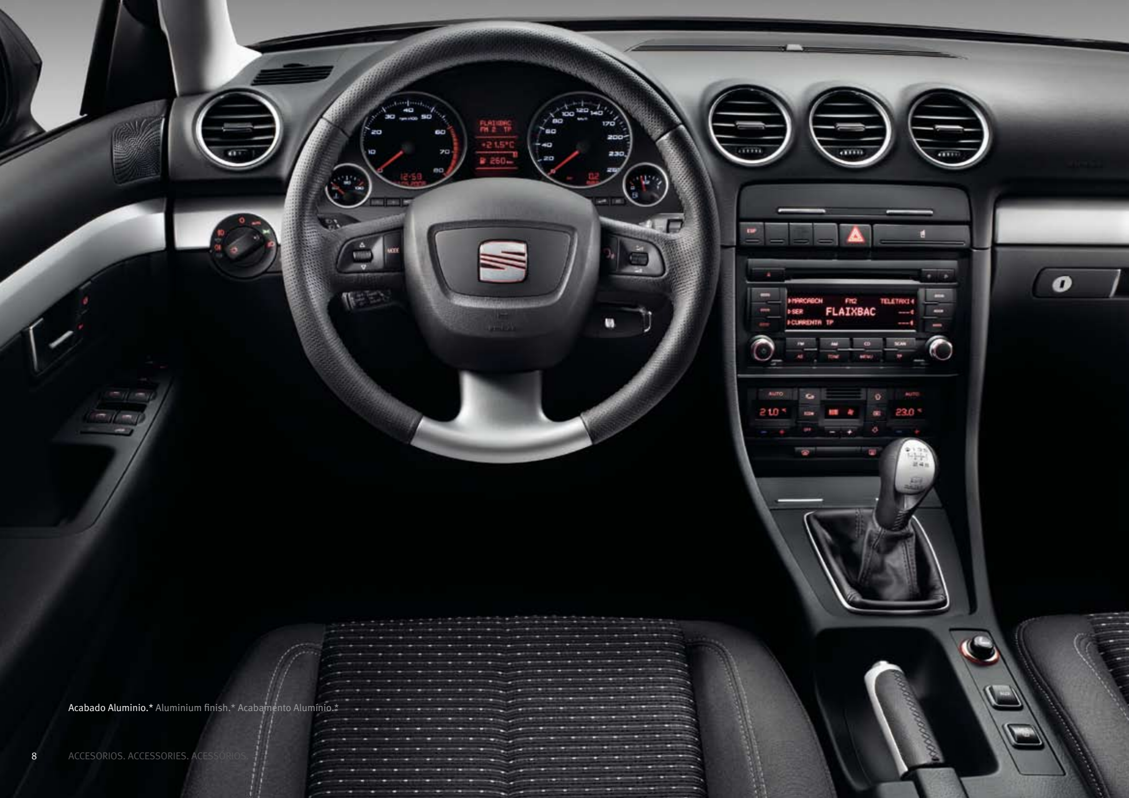
Acabado Aluminio.* Aluminium finish.* Acabamento Alumínio.*