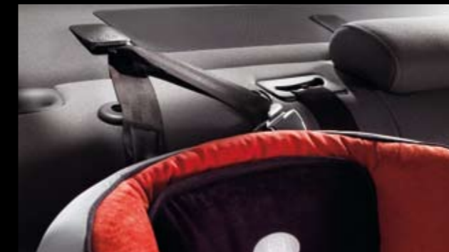
Cinturón Top Tether. Top Tether belt. Cinto de segurança Top Tether. 3R0019900

El cinturón Top Tether contrarresta el efecto de rotación hacia adelante en caso de un impacto frontal sujetando la parte superior del respaldo de la silla, evitando desplazamientos e incrementando la seguridad.