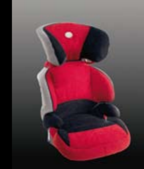
SEAT Peke G3 Plus. 000019222A