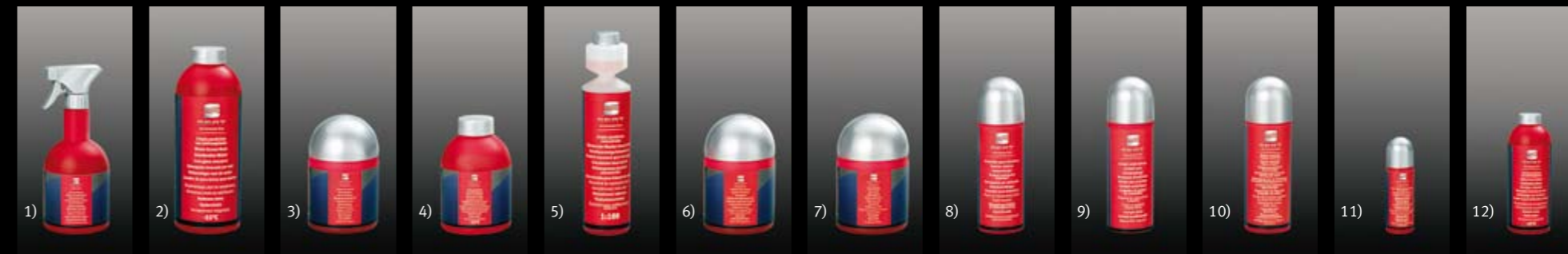
1) Limpiacristales quita insectos. 2) Limpiador para interiores. 3) Gel limpia llantas. 4) Protector para pieles. 5) Limpia salpicaderos. 6) Cera pulidora. 7) Champú con cera. 8) Grasa fluida y descongelante de cerraduras. 9) Limpia parabrisas concentrado. 10) Limpia parabrisas con anticongelante (-55°C), 500ml. 11) Limpia parabrisas con anticongelante (-55°C), 1000ml. 12) Descongelador.*