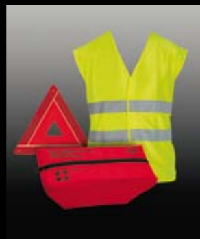
Elementos de emergencia.* Emergency features.* Elementos de emergência.*