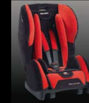
Recaro Young Expert Plus. 000019950C