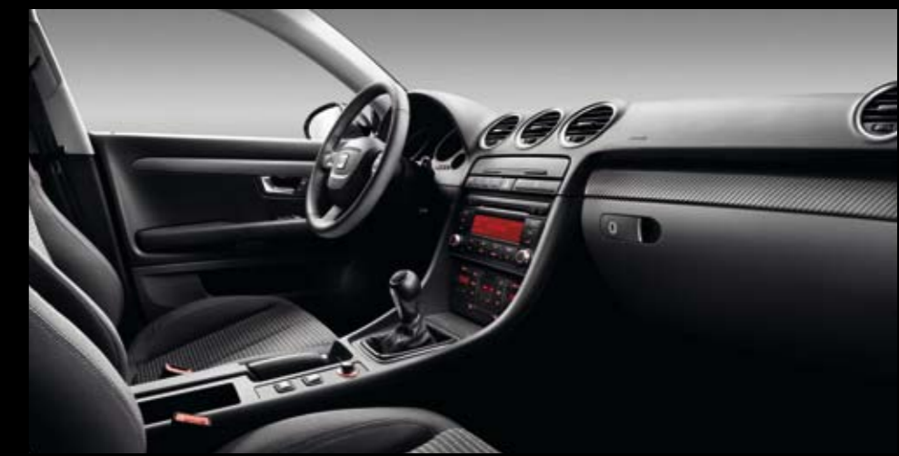
Moldura de tablero frontal, puertas delanteras y traseras con diseño en fibra de carbono.* Moulding for dashboard, front and rear doors designed in carbon fibre.* Moldura de painel frontal, portas dianteiras e traseiras, com design em fibra de carbono.*

Da un toque de distinción y elegancia al interior de tu EXEO. Volantes que, sin necesidad de modificar o sustituir el airbag, tienen un diseño cuidado hasta el último detalle y que en conjunto con el pomo de cambio y el recubrimiento del freno de mano le dan un acabado especial combinando con el acabado original del coche. Disponibles en acabado aluminio, negro piano y madera Wengué.