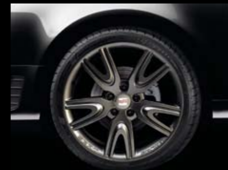
Antracita DV179 8x18" ET42 5x112. DV179 8x18" ET42 5x112 Anthracite. Antracite DV179 8x18" ET42 5x112. Ref. 3R0071496