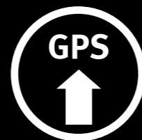
Localizador GPS. Localiza tu coche desde tu propio móvil, sin cuotas de servicio. GPS locator. Find your EXEO quickly and easily from your own mobile phone thanks to the GPS locator, with no service charges.

Localizador GPS. Localize o seu EXEO de forma fácil e simples a partir do seu próprio telemóvel, graças ao localizador GPS, sem quotas de serviço.