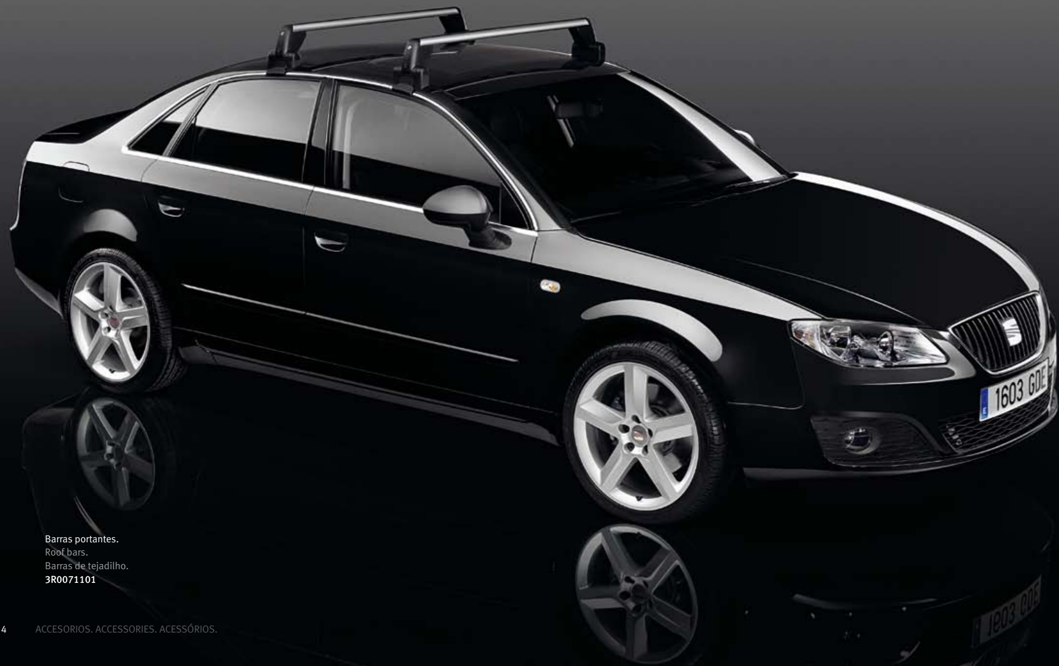
Barras portantes. Roof bars. Barras de tejadilho. 3R0071101