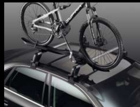
Portabicicleta.* Bicycle rack.* Porta-bicicleta.* 6L0071128A