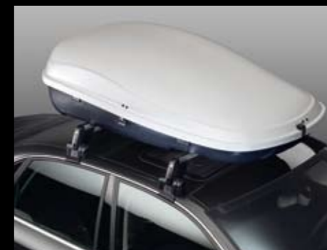
Baúl portaequipaje 450 l. de capacidad.* 450-litre capacity roof box.* Baú porta-bagagem 450 l. de capacidade.* 000071180A