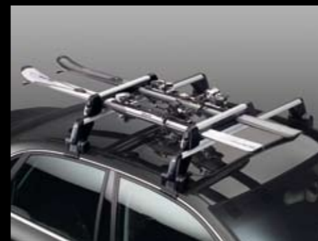
Portaesquí para transportar 4 pares de esquís o 2 snowboards.* Ski rack to carry 4 pairs of skis or 2 snowboards.* Porta-esquí para transportar 4 pares de esquís ou 2 snowboard.* 3B0071129F Portaesquí para transportar 6 pares de esquís o 4 snowboards.* Ski rack to carry 6 pairs of skis or 4 snowboards.* Porta-esquí para transportar 6 pares de esquís ou 4 snowboard.* 3B0071129G