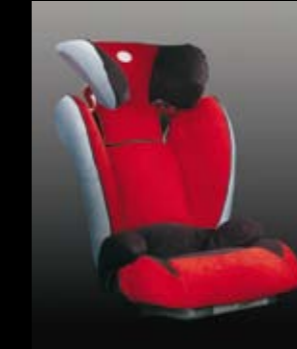
SEAT Peke G3 Kidfix. 000019223