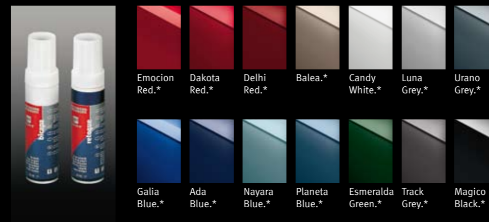
Emocion Red.* Dakota Red.* Delhi Red.* Balea.* Candy White.* Luna Grey.* Urano Grey.*