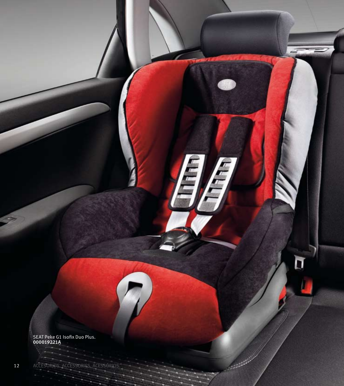
SEAT Peke G1 Isofix Duo Plus. 000019221A

Nos preocupamos por los tuyos. Las sillas de seguridad SEAT ofrecen diversos sistemas de seguridad, como el sistema Isofix y el cinturón Top Tether que aportan una seguridad adicional para los niños, pero siempre sin renunciar a su confort, con almohadillas laterales para reducir la carga sobre los hombros y la cabeza, o los cabezales regulables en altura. Sillas que se adaptan específicamente al peso y a la edad del niño. Las fundas son extraíbles y lavables, fabricadas con textiles de alta calidad que no se deforman ni pierden el color y la textura originales.