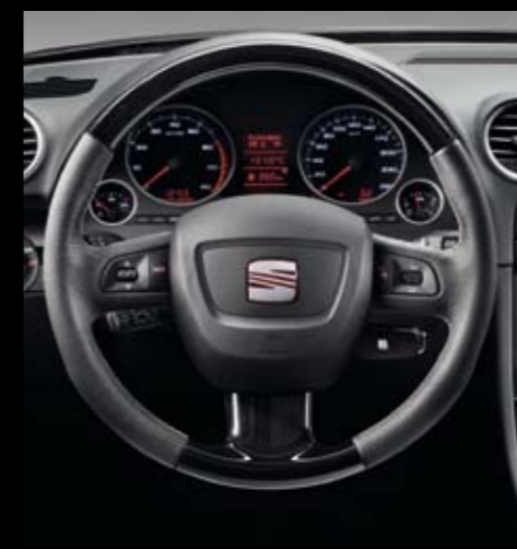
Acabado Negro Piano.* Piano black finish.* Acabamento Preto Piano.*