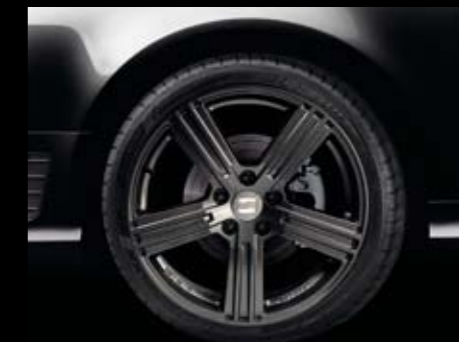
Antracita DV180 8x18" ET42 5x112. DV179 8x18" ET42 5x112 Anthracite. Antracite DV179 8x18" ET42 5x112. Ref. 3R0071498