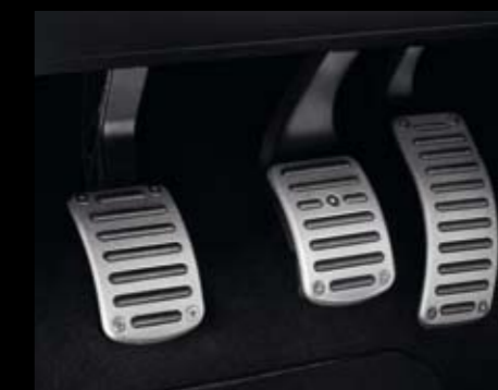
Pedales deportivos. Sport pedals. Pedais desportivos. 3R0071700