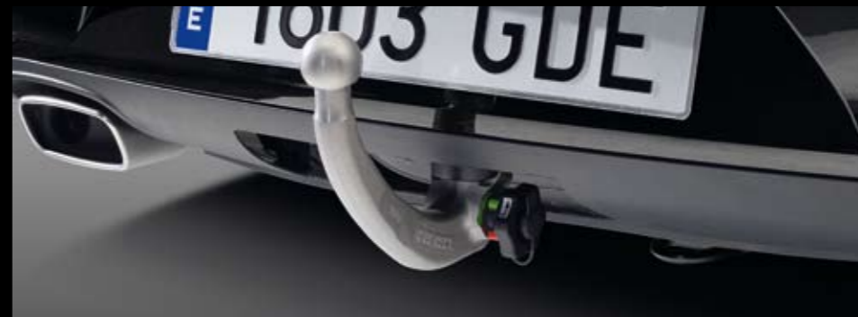
Gancho de remolque con bola desmontable. Tow hook with removable ball. Gancho de reboque com esfera desmontável. 3R0092155

Las barras portantes son la base para poder llevar todo lo que quieras, donde quieras, en combinación con los elementos de transporte. De fácil montaje y con un sistema de seguridad antirrobo, te permiten cargar con el equipaje, los esquís, las bicicletas y disfrutar plenamente de tu hobby. El gancho de remolque dispone de un sistema rápido y fácil de montaje y desmontaje, así como de un sistema de seguridad antirrobo con llave.