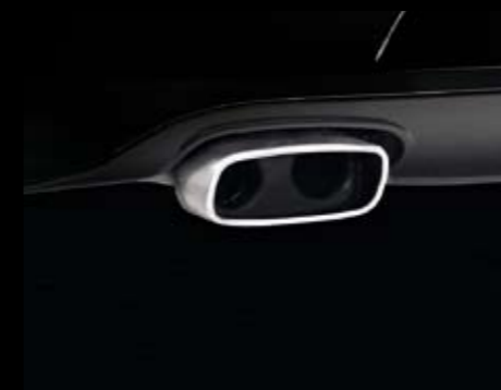
Embellecedor de tubo de escape. Exhaust pipe trim. Ponteira de tubo de escape. 3R0072000