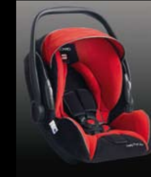
Recaro Young Profi Plus. 000019950B